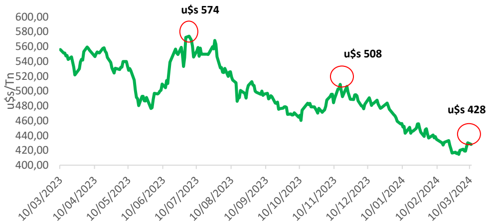
GRÁFICO 1: CHICAGO – EVOLUCIÓN ANUAL

Mercados: el avance de cosecha de Brasil sumado a las buenas perspectivas de la producción Argentina actúan como factores bajistas. Pese a esto, el interés de la demanda china sobre la soja brasilera presiona al alza la cotización, alcanzado los 428 u$/Tn.