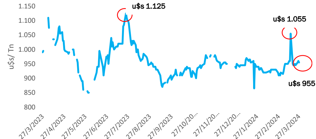
GRÁFICO 1: ROTTERDAM ACEITE DE GIRASOL

Mercados: en el informe de marzo, Oil World estimó una menor producción global de semilla, pero incrementó la producción de aceite traccionada principalmente por Rusia y en menor medida por Ucrania y Argentina.