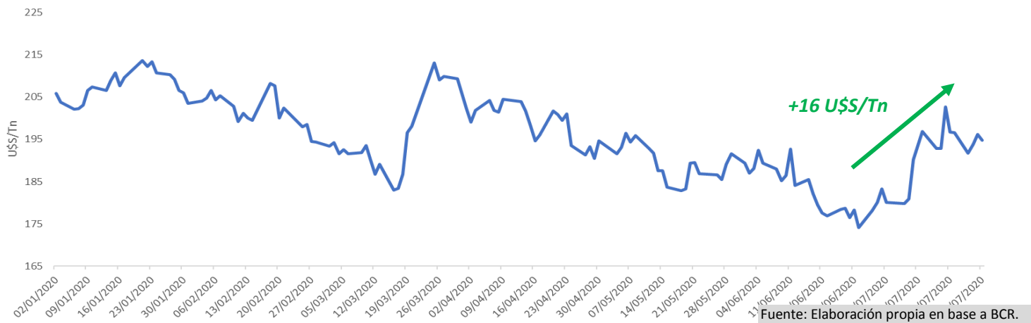
GRÁFICO 1: CHICAGO- EVOLUCIÓN 2020

El Informe del Monitor Siгранos , que indica el precio y la modalidad comercial de los contratos registrados, presenta los siguientes valores medios, condición cámara, al 23/7: a) Bahía Blanca, U$S/tn 195,0; b) Quequén, U$S/tn 179,2; c) Rosario Sur, U$S/tn 189,6 y d) Rosario Norte, U$S/tn 194,6.