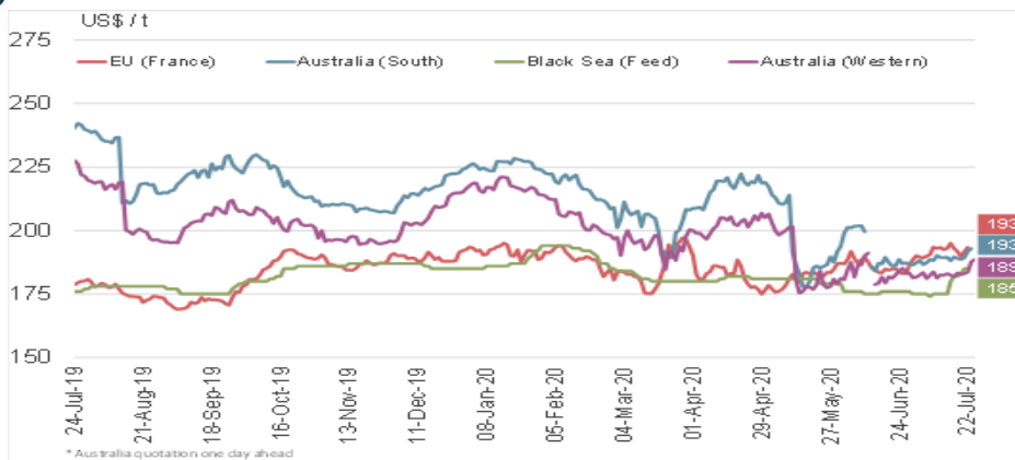
GRÁFICO 1: CEBADA: precios de exportación. Julio19 – Julio20

Mercado: a pesar de que continua la incertidumbre en el mercado de cebada a nivel mundial, las compras por parte de Arabia Saudita generaron una presión al alza sobre el precio.